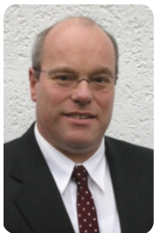
Baden-Württemberg